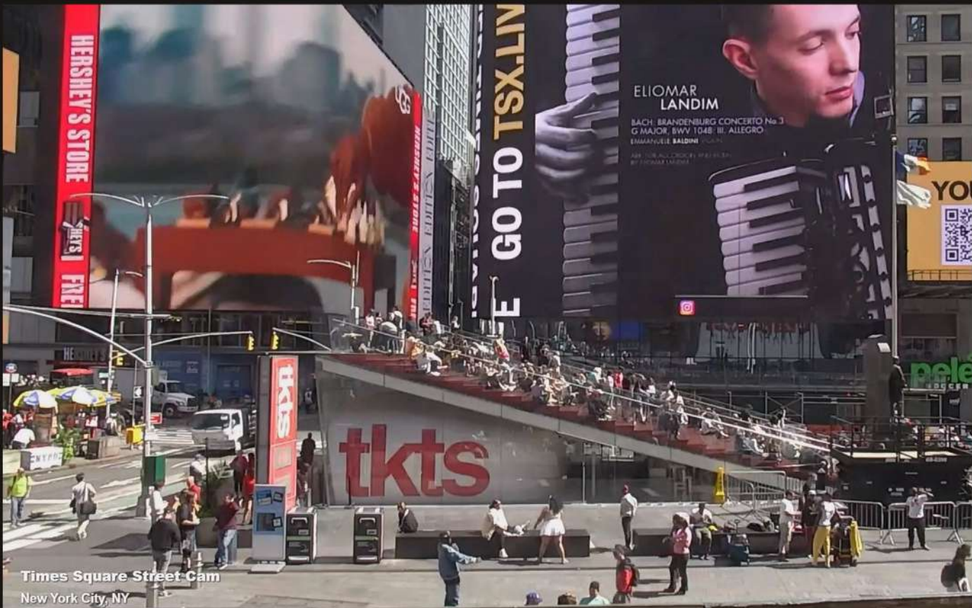
Times Square Street Cam New York City, NY